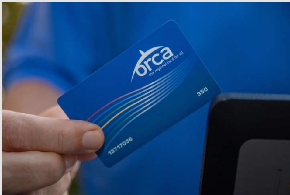
King County, 2020.